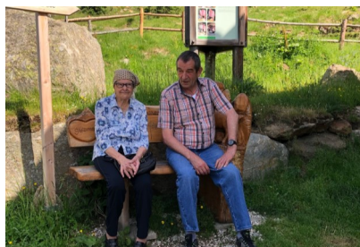
Ein Platzl im Schatten

ge Kaspressknödelsuppe und einen zünftigen Schweinsbraten ein. Wie es sich für eine flotte Almpartie gehört, war natürlich auch für die musikalische Unterhaltung bestens gesorgt und so mancher „Juchaza“ tönte fröhlich durchs Tal! ■