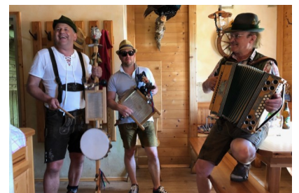
Drei fesche Musikanten