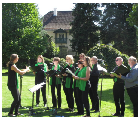
Zugestellt durch Post.at Amtliche Mitteilung der Gemeinde Teufenbach-Katsch